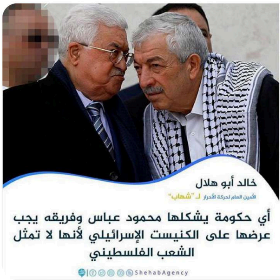
“The deal of the century!”